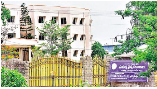
భువనగిరి ,జనవరి 21: